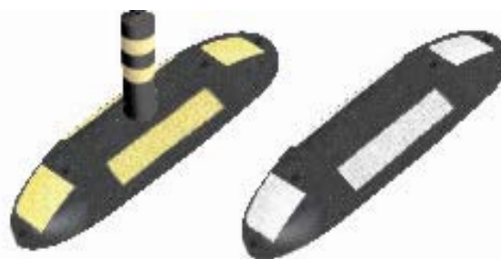
Balisa flexible reflectant nivell-2 opcional